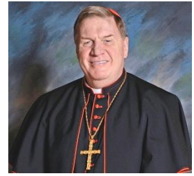
Cardenal Joseph W. Tobin, C.Ss.R. Arzobispo de Newark

Cuando los historiadores de la iglesia escriban sobre el Año de Nuestro Señor 2020, preveo que prestarán particular atención al "Gran Ayuno Eucarístico". COVID-19, la pandemia que se ha llevado la vida de millones de personas, obligó a las diócesis de todo el mundo a tomar la acción sin precedentes de cerrar nuestras iglesias y negar efectivamente a nuestro pueblo la oportunidad de recibir el Cuerpo y la Sangre de Cristo en la Eucaristía. Algunos estudiosos pudieran señalar que, como resultado, los católicos en Europa y América del Norte experimentaron lo que otros han sufrido durante muchos años debido a la escasez de sacerdotes o de una persecución abierta, concretamente, la ausencia de los sacramentos.