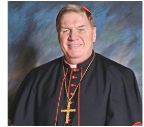
Kardynał Joseph W. Tobin, C.Ss.R. Arcybiskup Newark

Gdy historycy Kościoła będą pisać o Roku Pańskim 2020, przewiduję, iż zwrócą szczególną uwagę na „Wielki Post Eucharystyczny”. COVID-19, pandemia, która pochłonęła życie milionów ludzi, zmusiła diecezje na całym świecie do podjęcia bezprecedensowego działania polegającego na zamknięciu kościołów i skutecznego pozbawienia wiernych możliwości przyjęcia Ciała i Krwi Chrystusa w Sakramencie Eucharystii. Możliwe, iż niektórzy uczeni zauważą, że w rezultacie katolicy w Europie i Ameryce Północnej doświadczyli tego, co wielu wycierpiało przez wiele lat z powodu braku księży lub jawnych prześladowań, a mianowicie braku sakramentów.